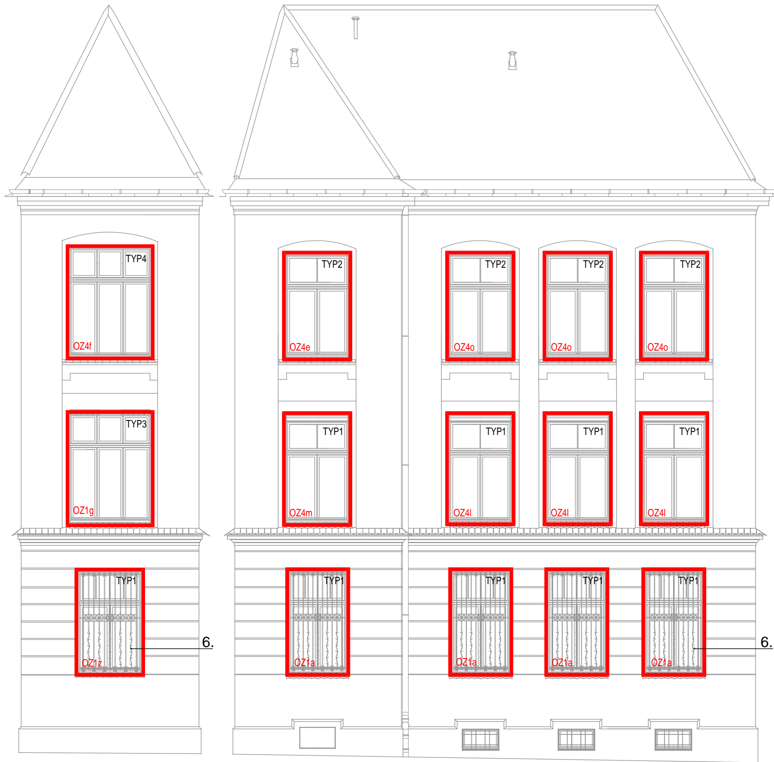
ELEVACJA B (1) - B (2)